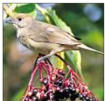
Die Mönchsgrasmücke liebt einheimische Beeren.

Der Schweizer Vogelschutz SVS/BirdLife Schweiz lädt auch dieses Jahr alle Interessierten ein, an der Aktion «Stunde der Gartenvögel» teilzunehmen, und dafür eine Stunde am 17. oder 18.